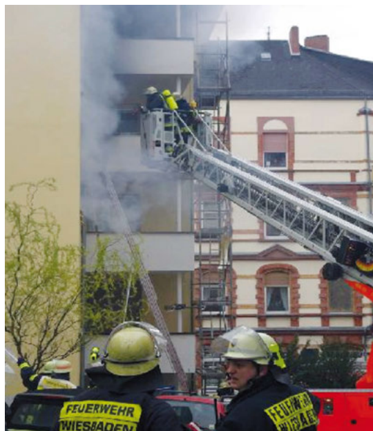
Slika: Vatrogasce Wiesbaden

Oni nesprecavaju vatru al osece miris i daju nama signal i mogucnost da iskoristimo to kratko vreme za spasavanje.